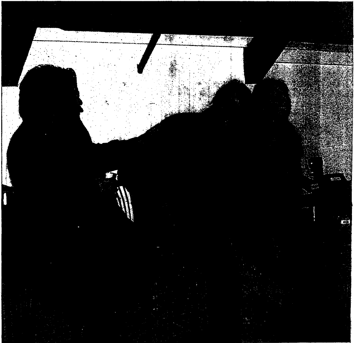
Ferdig. Montagna con Forza-visningen er over. Publikum var mange og fornøyde. Filmteamet kan slappe av.

Det er den kanskje, men jeg ser på den som både en konsertfilm og en