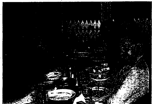
Middag. Suksessen ble feiret med middag på Lille Buddha.